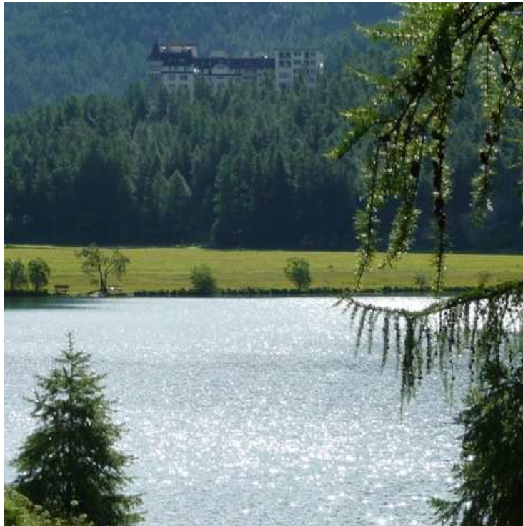
Hotel Waldhaus Sils-Maria