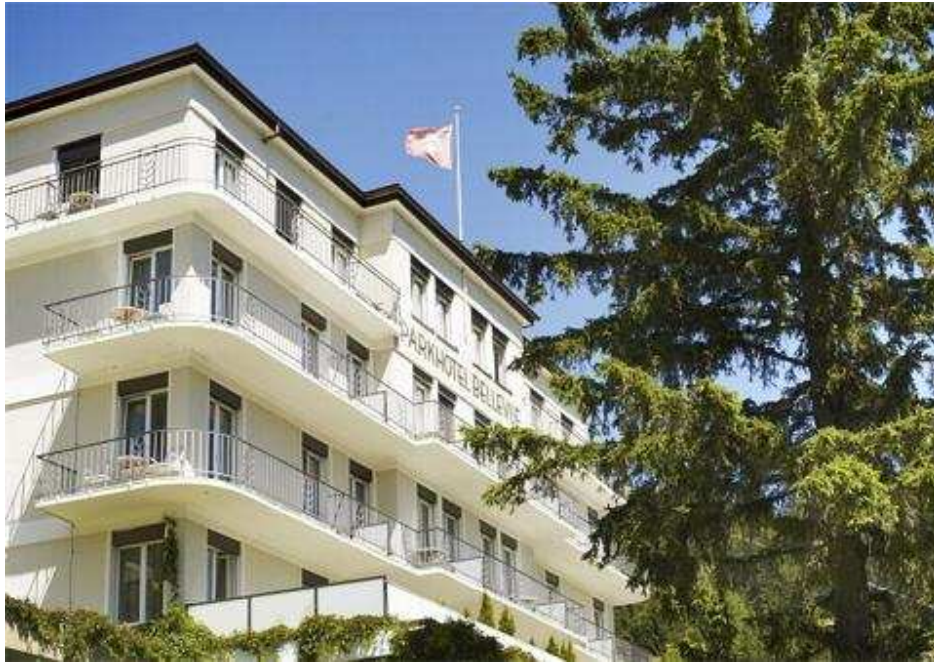
Parkhotel Bellevue – Adelboden

Wohnen Sie also an einer Lesung in der Bar bei, überraschen Sie die Musiker bei einer Probe, diskutieren Sie bei einem Spaziergang im hoteleigenen Park über das eben erlebte oder träumen Sie bei einer Tasse Tee einfach vor sich hin!