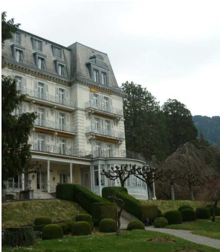
Hotel Righi Vaudois- Glion