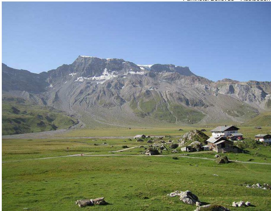
Engstligenalp – Adelboden

Damit auch die nicht im Hotel wohnenden Festivalbesucher Aimez-vous Brahms? geniessen können, werden viele verschiedene Konzerte an anderen Aufführungsstätten organisiert. So zum Beispiel bei einem „Konzert im Freien“ auf der einzigartigen Engstligenalp, in der wunderschönen Kirche von Adelboden, am Fusse des malerischen Oeschinensees, oder auch auf dem Niesenkulm und im Kongress und Kulturzentrum von Thun. Und wenn sie einmal genug von der Musik haben, können Sie auch in der speziell zusammengestellten Johannes Brahms Bibliothek herumstöbern!