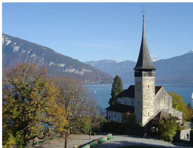
Schlosskirche - Spiez